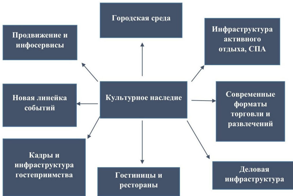
Рис. 2. Структура туристско-рекреационного кластера «Псковский»

ональной программы развития. В Эстонии на данный момент действует проект по созданию рекреационной зоны и туристского кластера в Сетомаа, а в рамках работы парламента Эстонии существует «Ассоциация поддержки Сетомаа» [4, 30].