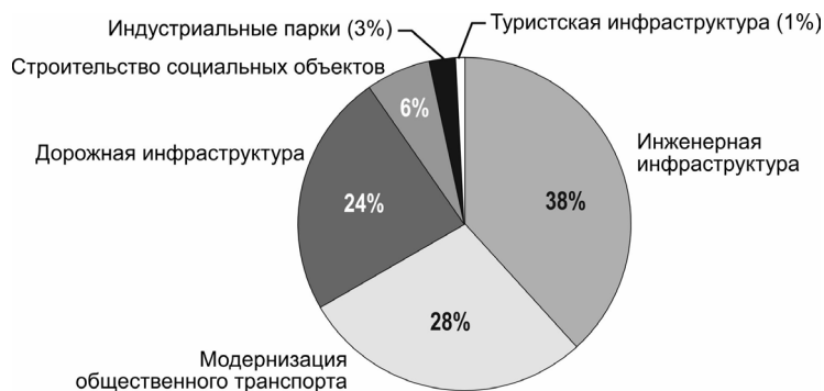
Рис. 4. Структура совокупной стоимости всех проектов, одобренных регионам на получение бюджетных инфраструктурных кредитов в рамках 500 млрд руб., выделенных на 2022–2023 гг., по типам проектов.