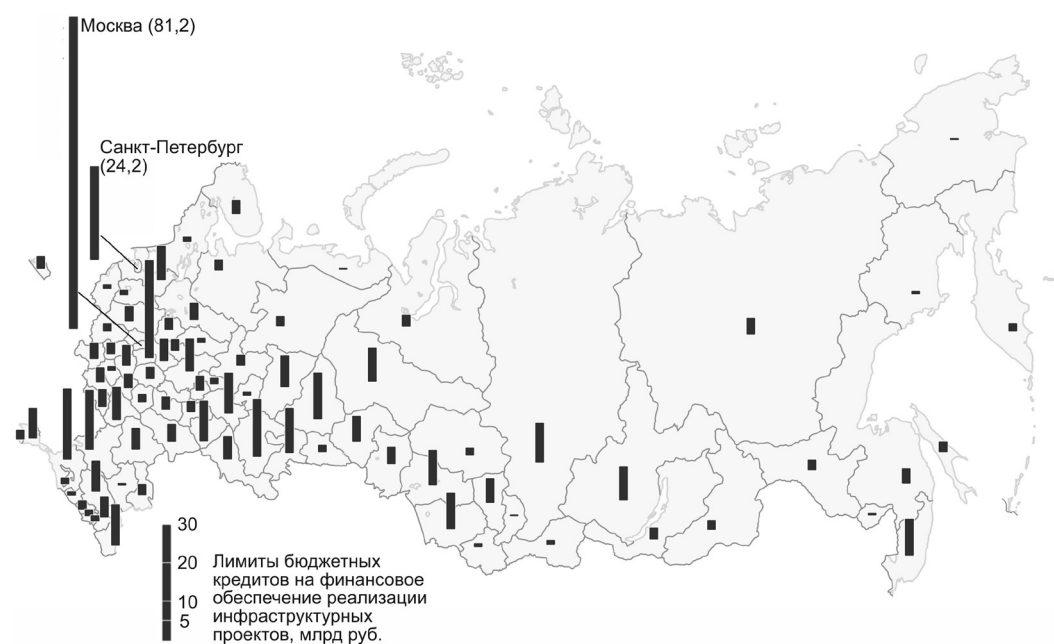
Рис. 2. Лимиты по предоставлению бюджетных инфраструктурных кредитов субъектам РФ на 2022–2023 гг., млрд руб.

Составлено авторами на основе данных Минэкономразвития России, представленных на круглом столе в Совете Федерации Федерального Собрания РФ по теме «Проектное управление в субъектах РФ» 04 октября 2021 г.