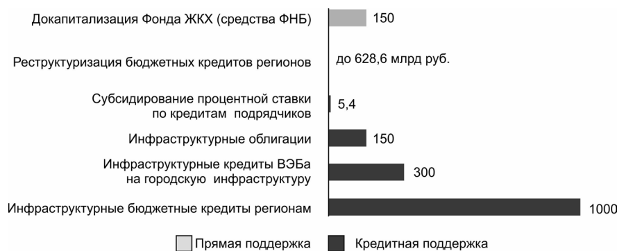
Рис. 1. Предельные объемы финансирования по инструментам «Инфраструктурного меню» до 2025 г., млрд руб.

В связи с этим задача данной статьи – провести анализ оснований для предостав-