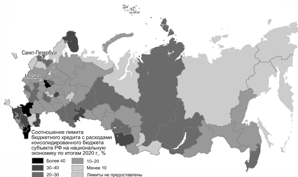
Рис. 3. Соотношение лимита бюджетного кредита с расходами консолидированного бюджета на национальную экономику в субъектах РФ по итогам 2020 г., %.

Одновременно с этим для 10 регионов установлен лимит менее 1 млрд руб. Пять субъектов РФ с самыми маленькими суммами (Республики Хакасия и Калмыкия, Ненецкий и Чукотский АО, Еврейская АО) вместе могли претендовать только на 0,3% от общего объёма государственной поддержки (табл. 1).