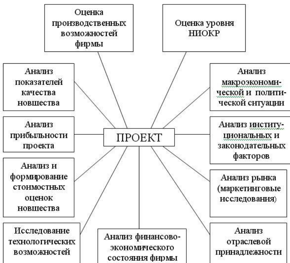
Рисунок 7 – Основные виды деятельности по созданию инновационного проекта