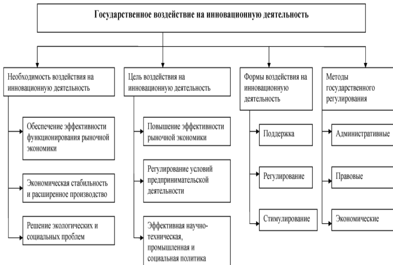
Рисунок 5 – Государственное влияние на инновационную деятельность

Задание 2. Охарактеризуйте особенности государственной инновационной политики России (рисунок 5)