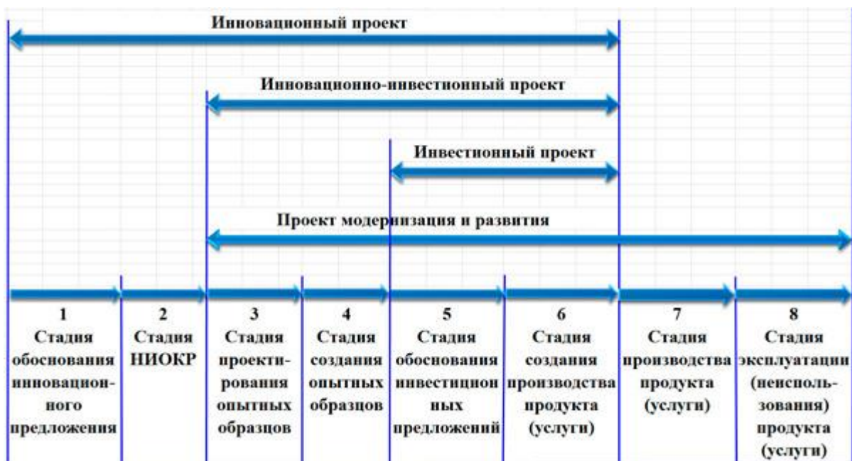
Рисунок 8 – Основные стадии подготовки инновационного проекта