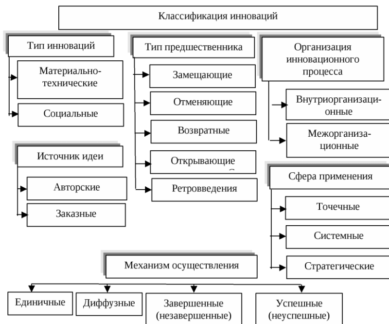
Рисунок 2 – Классификация инноваций