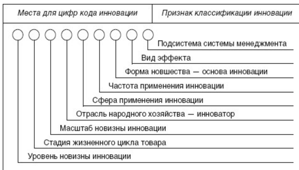
Рисунок 6 – Кодирование инноваций

Рассмотрим примеры кода инновации: 121132151, где цифры означают вид инновации по конкретным признакам, например: первая цифра означает - радикальное новшество; вторая - новшество разработано на стадии НИОКР; третья - новшество мирового уровня; четвертая - новшество создано в сфере науки; пятая - новшество создано в основном для продажи; шестая - инновация повторяющаяся; седьмая - инновация на основе изобретения; восьмая - эффект получен интегральный; девятая - инновация относится к подсистеме научного сопровождения системы инновационного менеджмента.