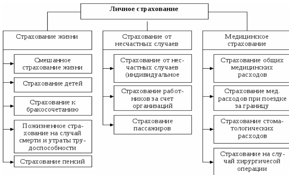
Рисунок 2 – Виды личного страхования