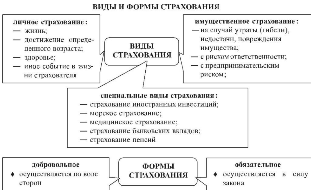
Рисунок 1 – Основные виды страхования

Задание. Изучите рисунок 1. Охарактеризуйте виды страхования. Какие виды страхования применяются в туристской деятельности?