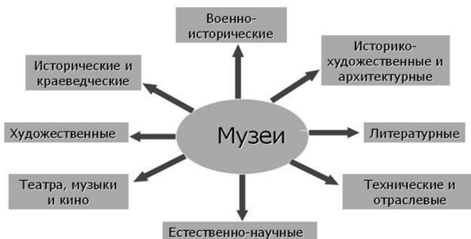
Рисунок 1 – Классификация музеев