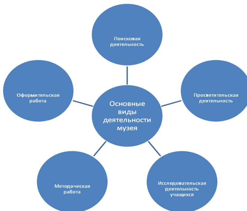
Рисунок 2 – Основные виды деятельности музеев