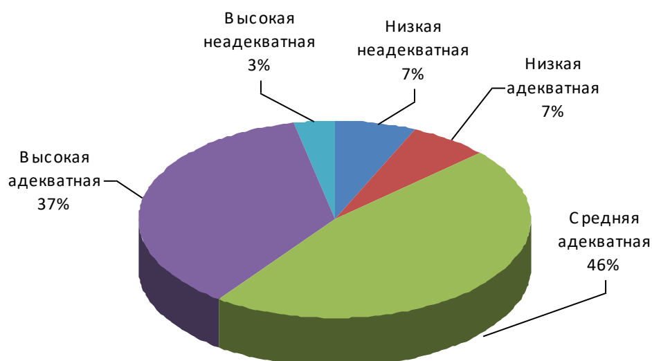
Рис. 3. Распределение уровней самооценки у респондентов по всей выборке