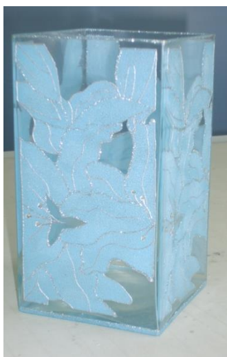
Рис. 1. Ваза «Зимняя сказка»

Для выполнения данного типа росписи нам понадобятся: скотч, ножницы, губка поролоновая, стекло, суперклей, самоклеющаяся двухсторонняя пленка, копировальная бумага, карандаш, контуры четырех видов (голубой перламутровый, прозрачный, толстый серебряный с блестками и тонкий корректирующий серебряный), глиттер (специальный блестящий порошок, используемый для окончательной декорировки изделия), стразы двух размеров (рис. 2).