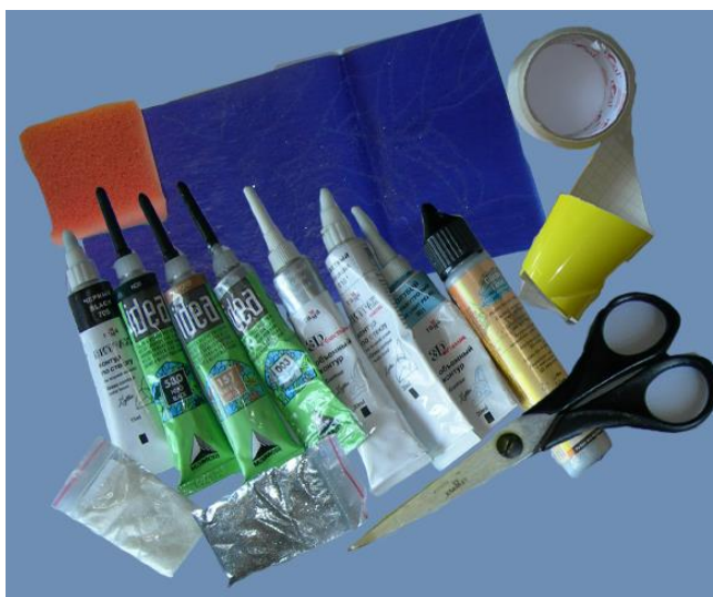
Рис. 2 Инструменты и материалы для росписи