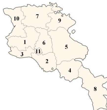
Рис. Административно-территориальное деление Армении

Задание для самостоятельной работы. Построить на основании данных таблицы 3 круговую диаграмму «Доля административно-территориальных единиц в населении Армении (2019 г.)».