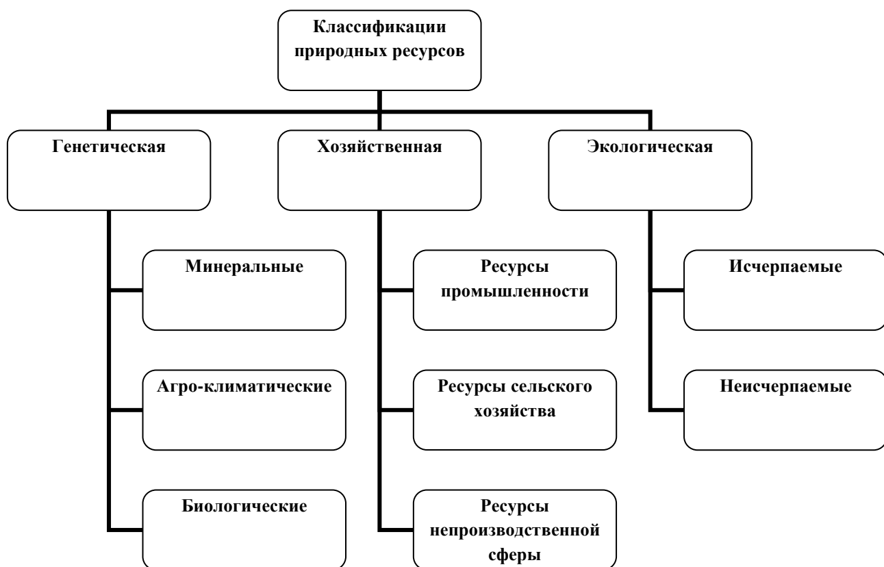
Рис. 2 Классификации природных ресурсов