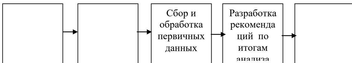
Рис. 2. Этапы маркетингового исследования

Задание 2. Впишите на схеме (рис. 2) пропущенные этапы маркетингового исследования