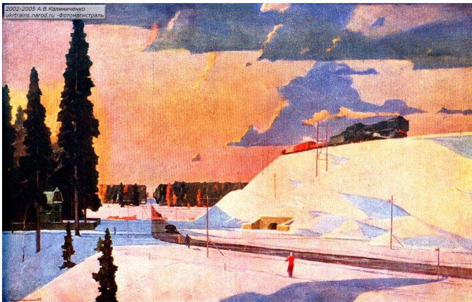
Г. Г. Нисский. ПЕРЕД МОСКВОЙ. ФЕВРАЛЬ.