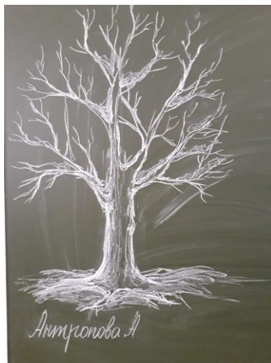
Пример выполнения задания

3.Выполнить педагогический рисунок дерева на доске. Используя приемы стилизации выполнить стилизованное изображение дерева. Составить алгоритм объяснения для учащихся 5 класса.