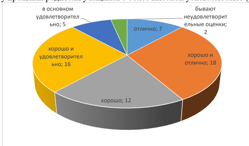
Рис. 1. Распределение участников опроса в зависимости от успеваемости детей

С учетом успеваемости учащихся можно предположить, что интерес к опросу проявили родители учащихся с более высокой успеваемостью (рис.1)